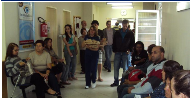
Pacientes esperando atendimento.