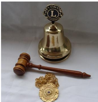
Sino, Martelo e Colar de MC (Sob Encomenda)