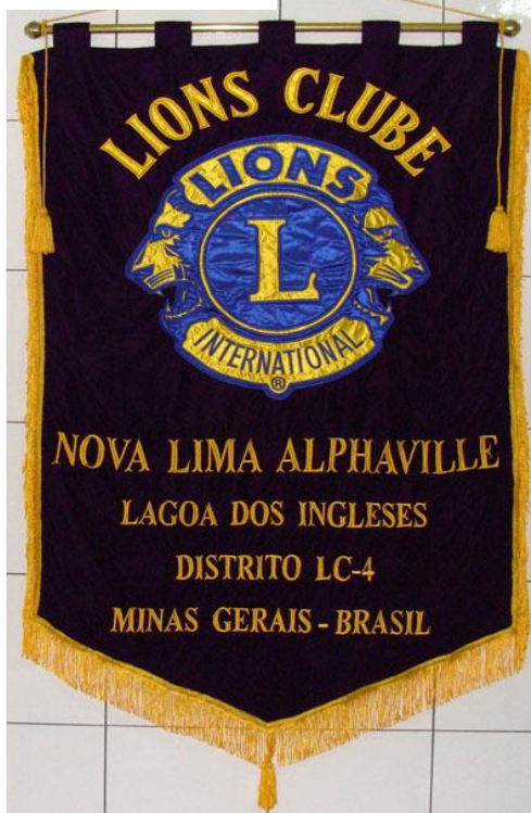
Estandarte (Sob Encomenda).