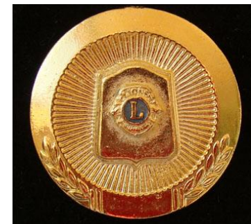
Medalha de Premiação (Sob Encomenda)