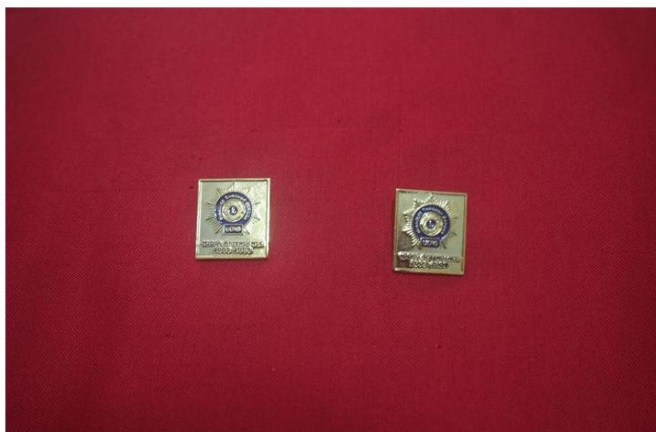
Pins 100% (Sob Encomenda)