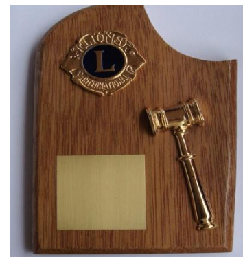
Troféu: Presidente, Secretário e Tesoureiro (Sob Encomenda)