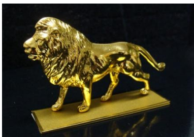
Troféu Leão banhado a Ouro (Sob encomenda)