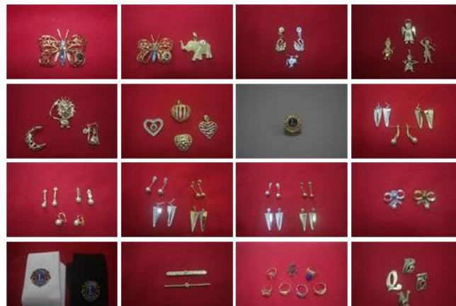
Pins Diversos e outros Materiais.