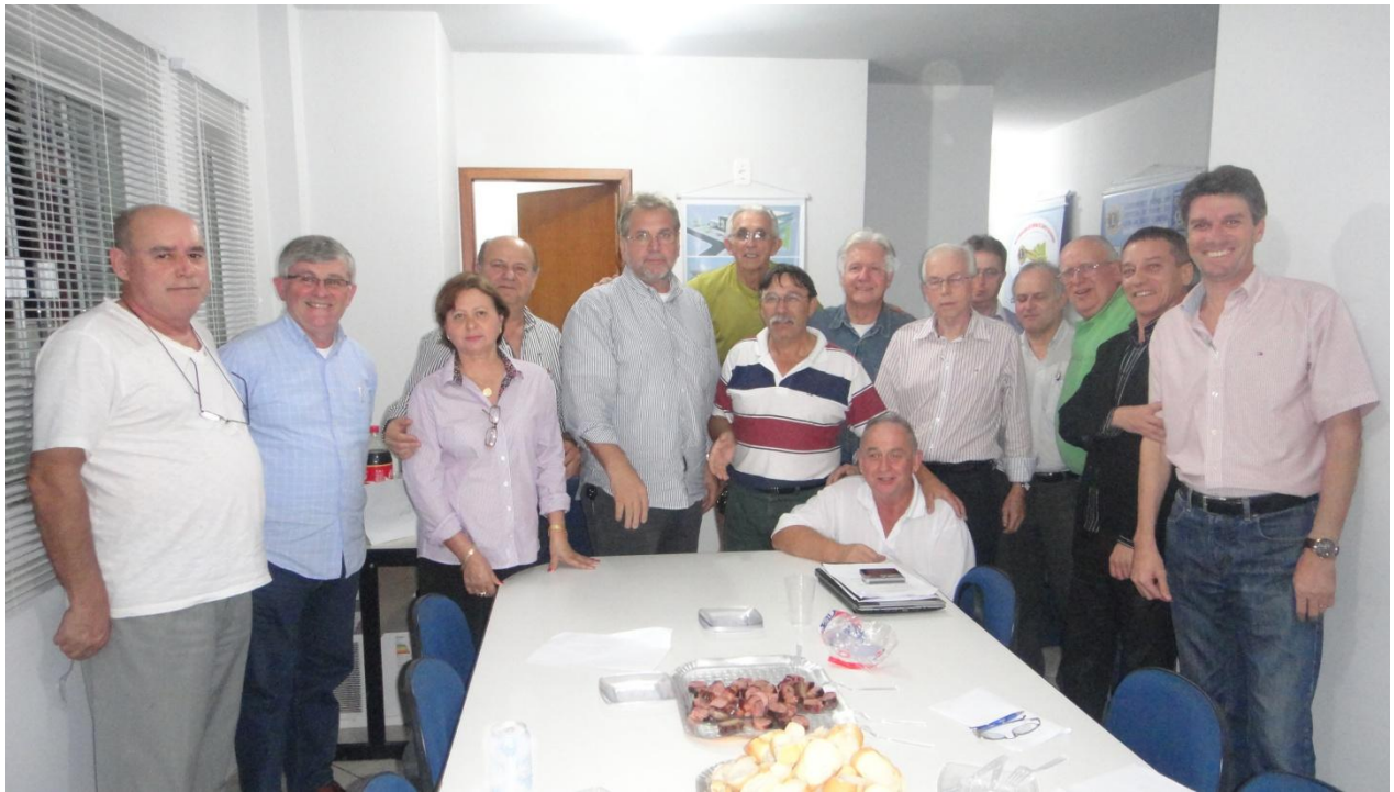
Diretoria Instituto Lions AL 2012/2013, toma posse em sua sede a Rua Imola, 140, Apto. 02 – Paganni II – Palhoça/SC.