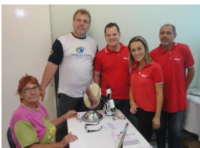
Ótica Diniz, parceira com a Essilor.