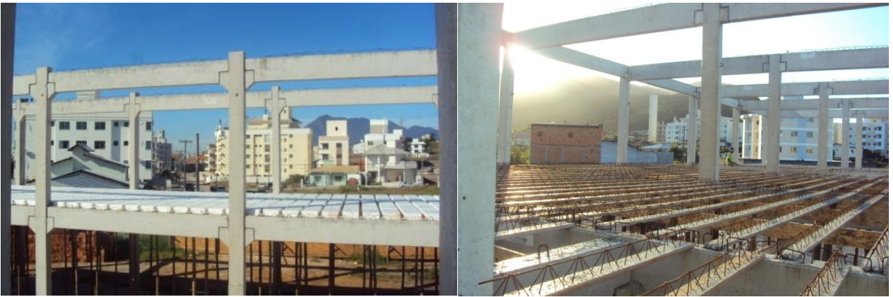
Montagem das lajes dos pisos superiores para concretagem.