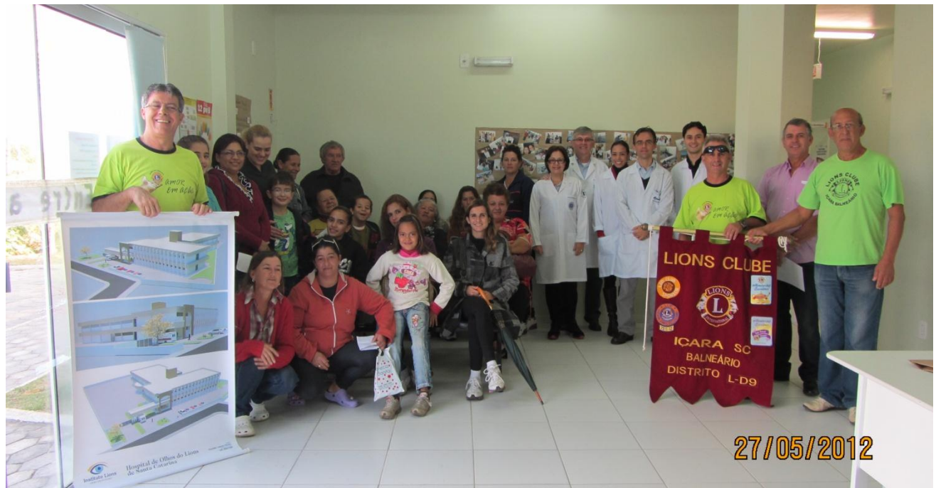
Equipe Médica, Companheiro(a)s do LC Içara Balneário e Pacientes posando para uma foto.