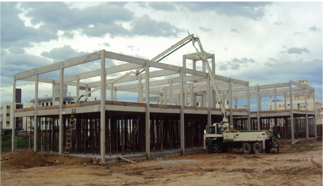
Concretagem das lajes dos pisos superiores.