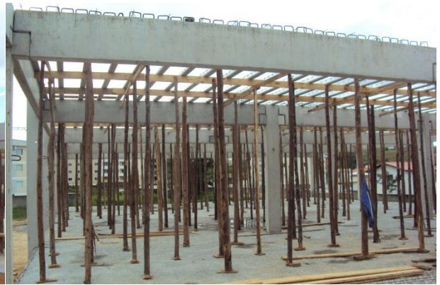
Montagem das lajes de cobertura para concretagem.