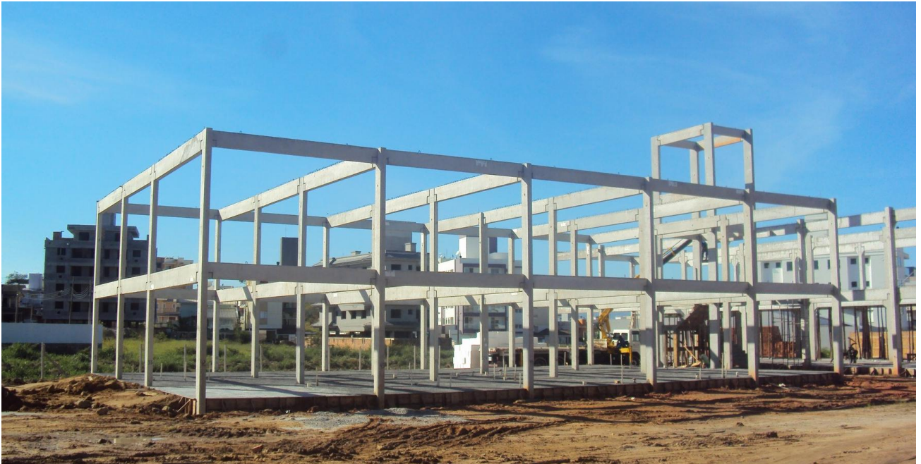
Concretagem do contra piso do módulo II.