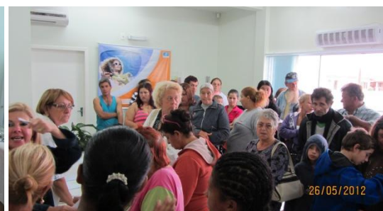
Pacientes esperando o atendimento.