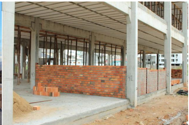
Início do fechamento das paredes.