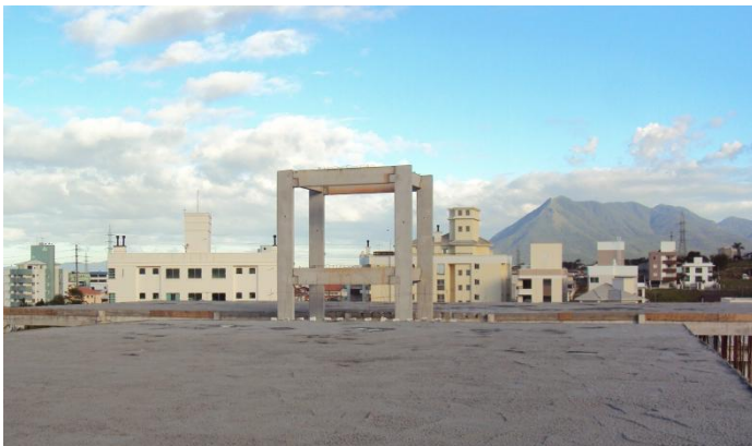
Concretagem das lajes de cobertura.