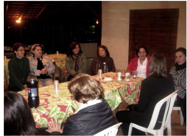
Confraternização ao final dos trabalhos.