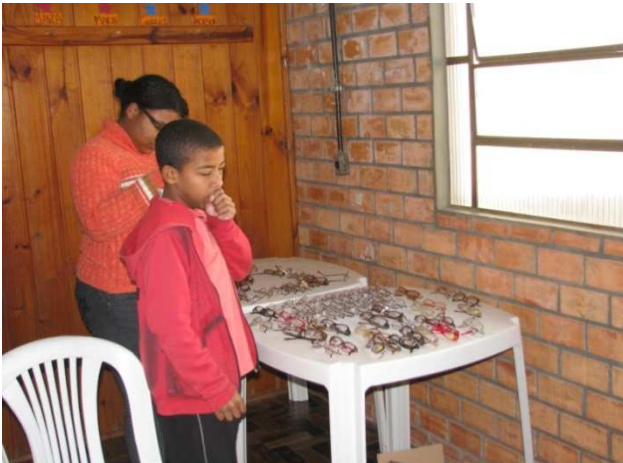
Paciente escolhe armação para as lentes.