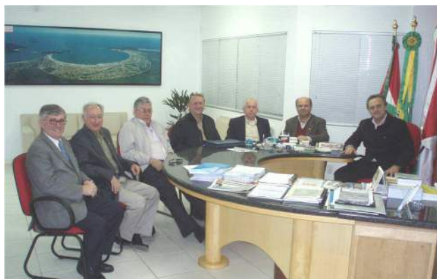
AGOSTO de 2007 – Reunião com o Prefeito Municipal de Palhoça para aquisição do 1º. terreno do Hospital de Olhos.

Um 2º projeto foi dado entrada na Vigilância Sanitária. Neste foram detectados falhas técnicas e o mesmo foi arquivado por falta de providências.