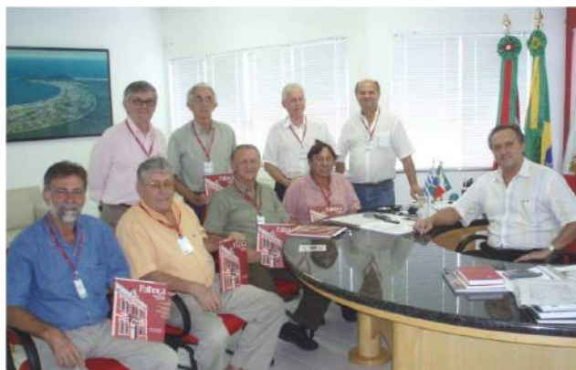
MARÇO de 2009 – Reunião com o Prefeito Municipal de Palhoça para aquisição do 2º. terreno do Hospital de Olhos.